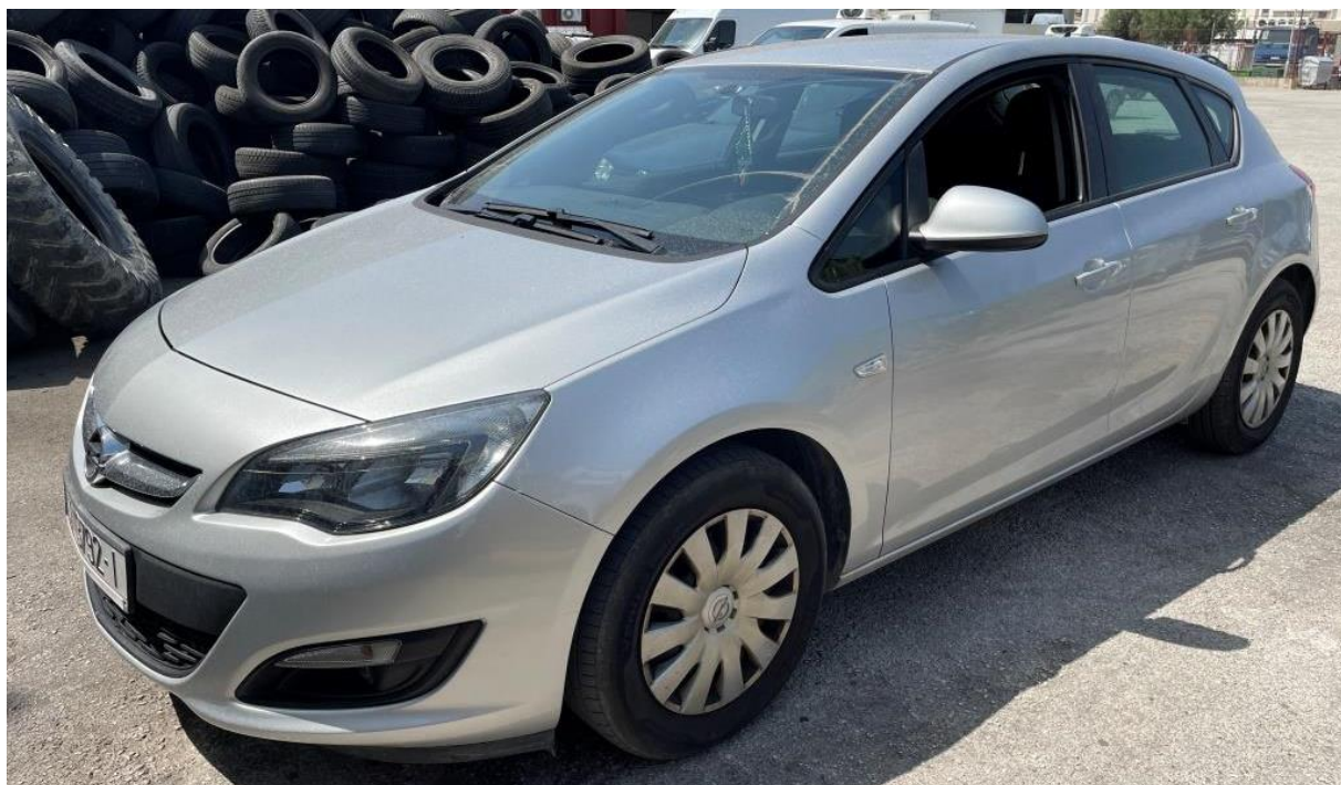
Slike 1. do 10.: Prikaz općeg stanja automobila